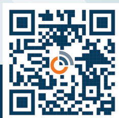
NOTICE MODULE PRINCIPAL