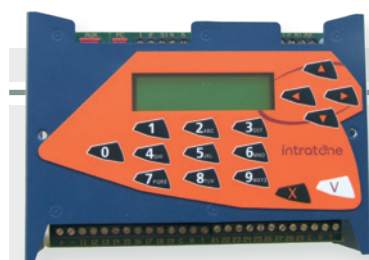
03-0101 : Centrale de gestion 2 portes et/ou 1 000 noms en temps réel